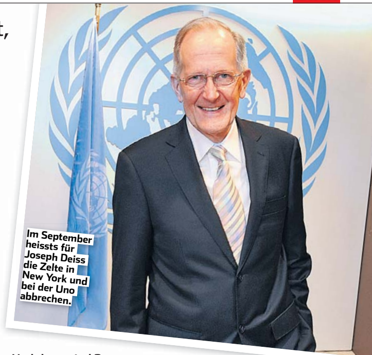
Im September heisst für Joseph Deiss die Zelte in New York und bei der Uno abbrechen.

Ich bitte die Redner, nicht einfach ihren Text herunterzulesen. Den können sie uns geben, damit das ganze Statement deponiert ist. Sie sollen auch auf Fragen im Plenum antworten. So haben wir Leben in die Sitzungen gebracht.