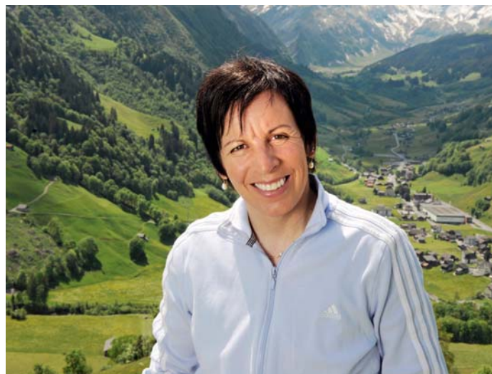
55 Weltcup-Siege erfahren: Ex-Skistar Vreni Schneider.

In der kommenden – und wie sich später herausstellte – letzten Saison habe ich tatsächlich zum dritten Mal den Gesamtweltcup gewonnen, dazu die Riesenslalom- und die Slalomkugel. Und ich wusste schon beim Final in Bormio: «Das isch es gsi.» Trotzdem: Vor der endgültigen